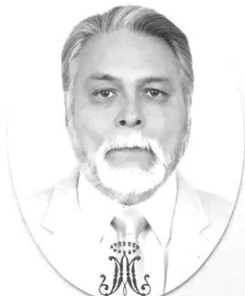
UNIVERSIDAD MARISTA de San Luis Potosí | Rector | Clave Institución: 24MSU0060N

Con reconocimiento de validez oficial de estudios de la Secretaría de Educación del Gobierno del Estado de San Luis Potosí, según acuerdo No. ES98009 de fecha 19 de agosto de 1998, en atención a que terminó los estudios correspondientes el día 31 de enero del 2002.